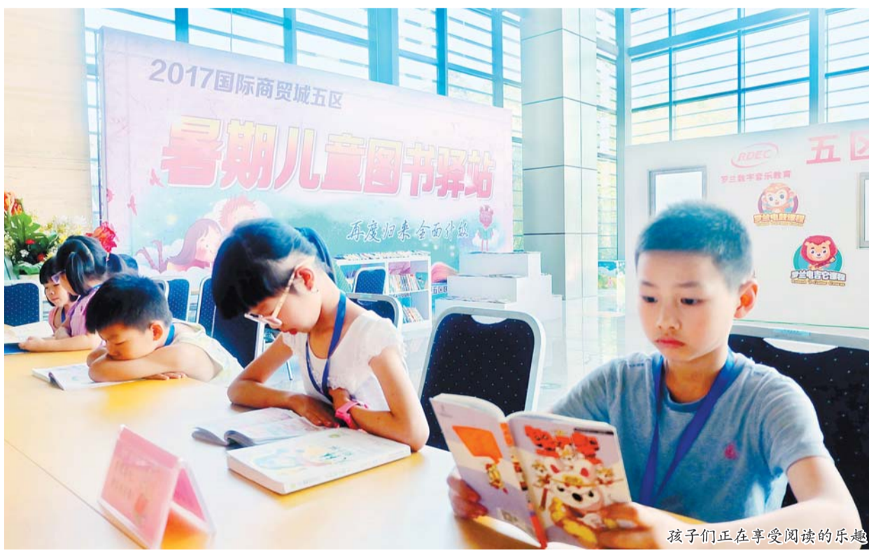
孩子们正在享受阅读的乐趣

记者了解到，市场经营户的孩子只要在家长的陪伴下捐赠一本儿童图书并签署《安全责任书》，领取读书证后即可每日凭证入场，8月底活动结束后还可从图书驿站领走一本自己喜爱的图书；采购商的孩子也可以凭借现场工作人员提供的临时读书证入场。“这个驿站可以让孩子们远离电子产品，恢复纸质阅读，而且还能确保孩子安全地过暑假，真的非常有意。”现场，一名陪伴孩子前来阅读的家长表示，读书证上不仅有孩子的姓名、年龄，还有家长的姓名、商位号和联系方式，这让家长们非常放心。