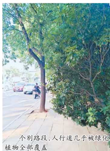
个别路段，人行道几乎被绿化植物全部覆盖